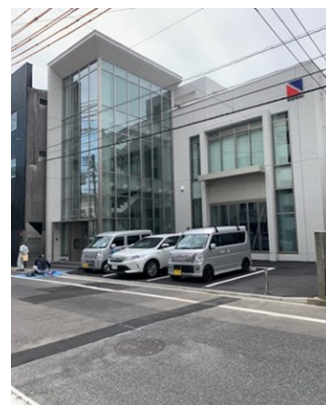
第2工場（西区中広町）