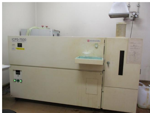
ICP 発光分光分析装置