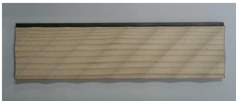
持参された壁材の一例

* STLデータとは、3次元の立体形状を小さな三角形の集合体として表現するシステムです。