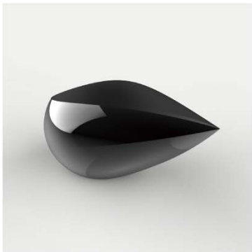
デザイン提案時のCG

商品化に至り、同社の店舗(本店)にて販売中です。この商品は、第16回ひろしまグッドデザイン賞の奨励賞を受賞しました。