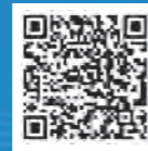
【公式】いい店ひろしま Instagram