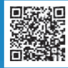
広島市中小企業支援センター ホームページ

〒733-0834 広島市西区草津新町一丁目21番35号(広島ミクシス・ビル2階) TEL 082-278-8032 FAX 082-278-8570 E-mail: assist@ipc.city.hiroshima.jp URL: https://www.assist.ipc.city.hiroshima.jp/