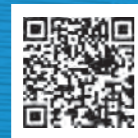
広島市工業技術センター ホームページ

〒730-0052 広島市中区千田町三丁目8番24号(広島市工業技術センター内) TEL 082-242-4170 FAX 082-245-7199 E-mail: kougi@itc.city.hiroshima.jp URL: https://www.itc.city.hiroshima.jp/